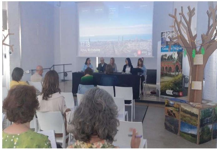
Jornada Pobresa Infantil feta a Barcelona Casa del Aigua TN