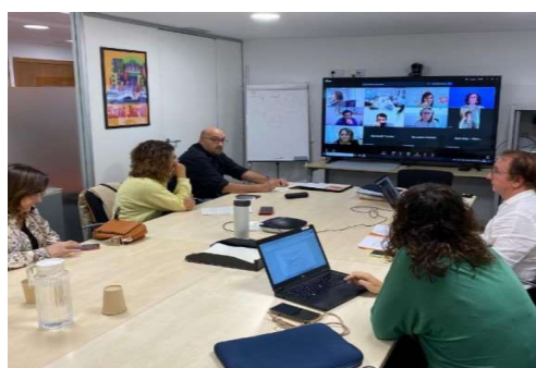
Participants Grup Treball Metropolitana Infancia en Barcelona