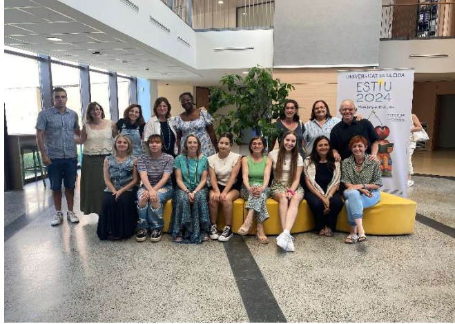
Universitat d'Estiu UdL