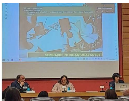
Seminari Internacional sobre tracta NNA FAPMI-ECPAT a U. Comillas