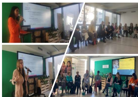
Jornada EDUCO "Costes violencia contra NNA"