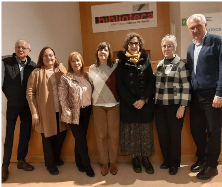
Jornada Pobresa Infantil feta a Biblioteca de Lleida